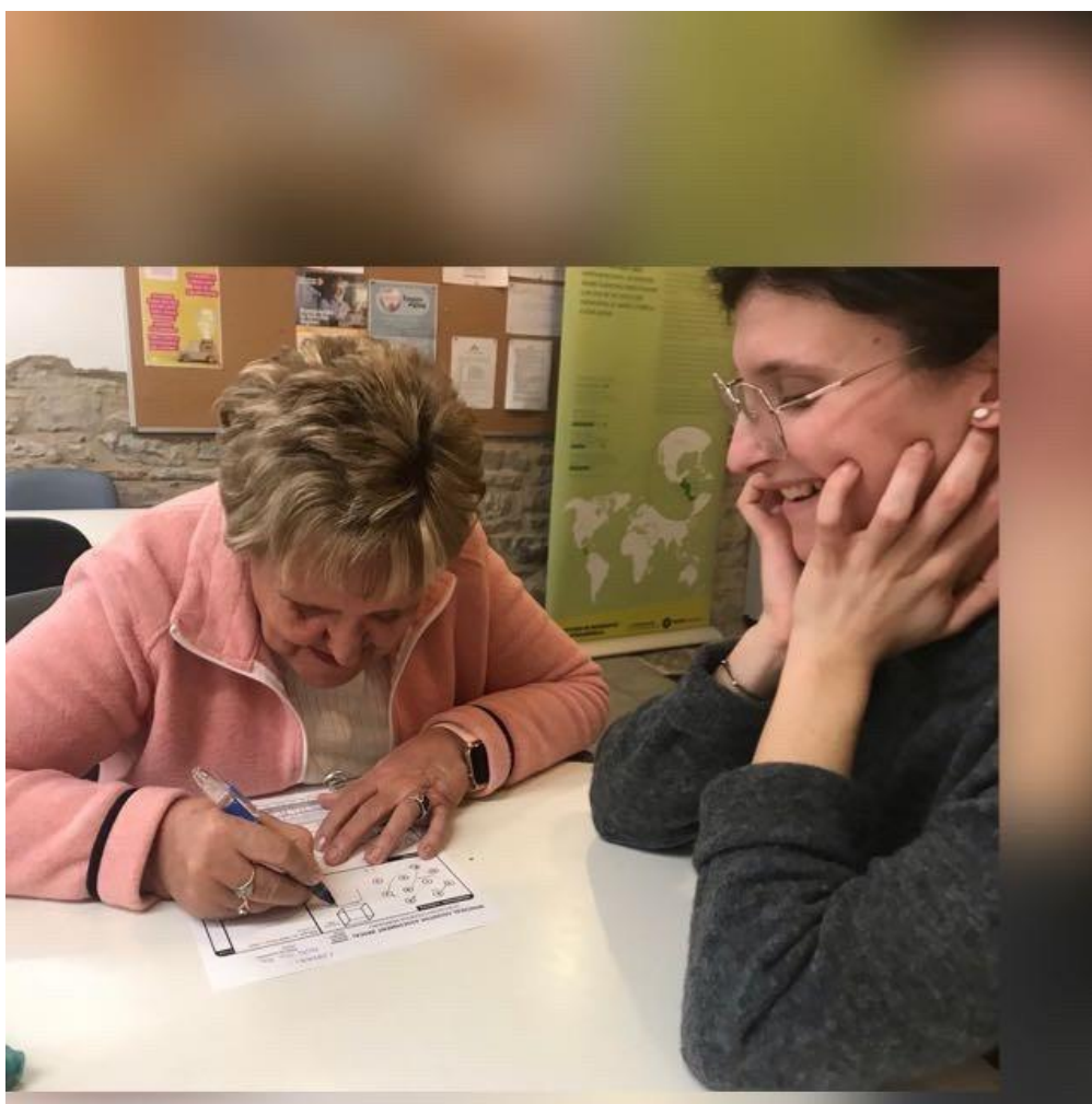
Ilustración 2 Valoración de participantes en el taller por medio de escalas validadas

3- No dejes de usar la lista de Spotify “Programación ImproAging” donde encontraras los recursos que mencionamos en los diferentes ejercicios.